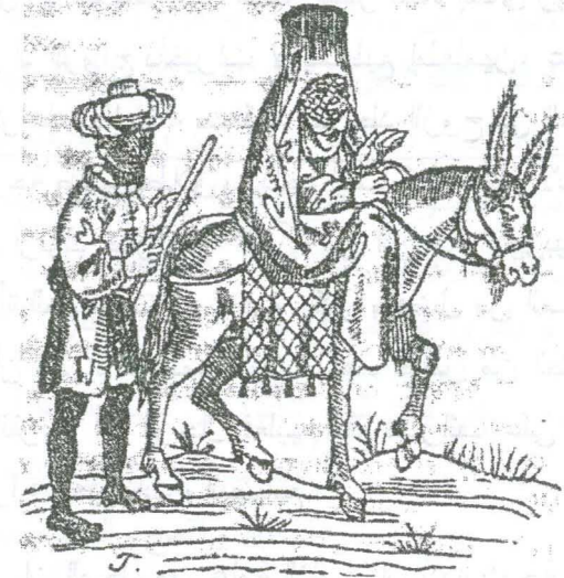
رسم رقم (٦) امرأة بطربوش فوق رأسها، تمتطي حماراً يقوده غلامها

(٩٠١-٩٠٤هـ/ ١٤٩٦-١٤٩٨م)، ويبدو الطربوش فوق رأس امرأة تمتطي حماراً يقوده غلامها، يقوم بمهمة المكارى. وهذا الغلام يتميز بالبساطة فى الملبس، كما يوضحه أنه عارى القدمين وفى يده اليمنى عصاته المستخدمة ليسوق بها الحمار، وفوق رأس هذا الغلام عمامه تلف حول طاقيه. أما السيدة التى من المؤكد أن زوجها كان مقتدراً، فطربوشها يشبه القبعة، وتغطيه عصابة فضفاضة طويلة لا تقل عن ثلاثة أذرع (١) ، وترتدى ملابسها التقليدية (٢) .